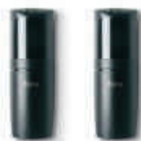
FT210B fotokomórki (para-bez baterii) BLUEBUS , nastawne z kątem 210°, zasięg 15 m