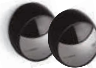
MOFB fotokomórki (para) BLUEBUS zasięg 15-30 m