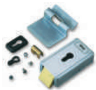
PLA 10 zamek elektromagnetyczny pionowy

inne dodatkowe akcesoria - patrz strony 80 - 87