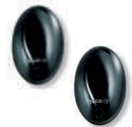
BF fotokomórka (para) zasięg 15-30m