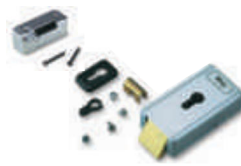
PLA 11 zamek elektromagnetyczny poziomy