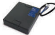
PS324 akumulator 24V 2.2 Ah z wbudowaną kartą ładowania do centrali MC824H