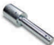
CRA9 adaptor do SUMO na wał: 1¼", 35mm, 40mm