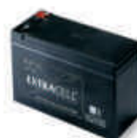
B12-B akumulator 12V 6.0 Ah