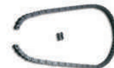
CRA4 łańcuch 5 m plus spinka do łańcucha