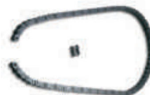
CRA3 łańcuch 1 m plus spinka do łańcucha