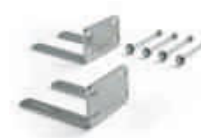
CRA8 dodatkowe uchwyty mocujące silownik do ściany przy bocznym montażu - do bram rozsuwanych