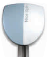
SPIN siłownik z wbudowaną centralą sterującą BLUEBUS