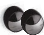
MOFB 1 komplet fotokomórek BLUEBUS