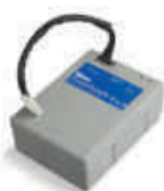
PS124 akumulator 24V 1.2 Ah z wbudowaną kartą ładowania

inne dodatkowe akcesoria - patrz strony 80 - 87