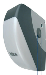
SOON siłownik 24V z wbudowaną centralą sterującą BLUEBUS