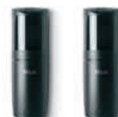
F210B fotokomórki (para) BLUEBUS , nastawne z kątem 210°, zasięg 15 m