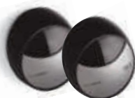
MOFB fotokomórki (para) BLUEBUS